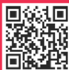
Exhibit at the 5th edition of India's leading B2B aftermarket expo

Our show floor is almost booked. Reserve a premium booth now.